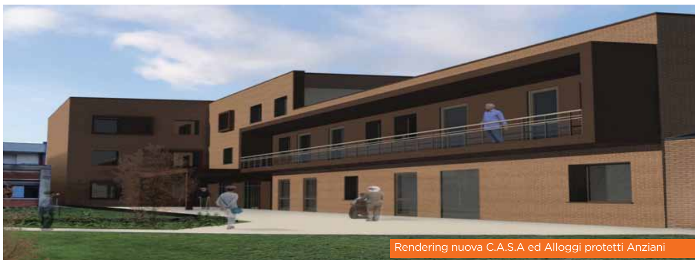
Rendering nuova C.A.S.A ed Alloggi protetti Anziani

LA RSA OGGETTO DI RIQUALIFICAZIONE GLOBALE HA UNA SUPERFICIE COMPLESSIVA DI MQ 2.600 + MQ 700 DI INTERRATO. CON LA RISTRUTTURAZIONE SARANNO REALIZZATE LE SEGUENTI PRINCIPALI OPERE: