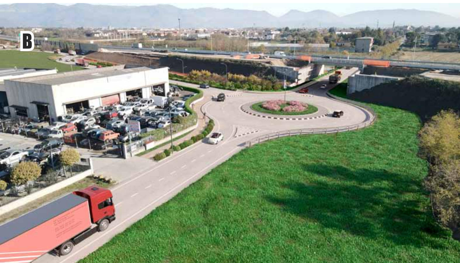
ROTATORIA IN VIA D. GHIDONI, INIZIO CIRCONVALLAZIONE NORD