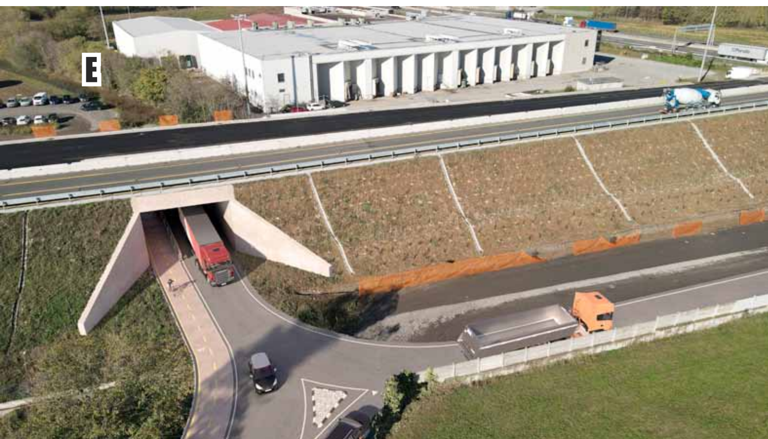
NUOVO SOTTOPASSO DI VIA FALCONE