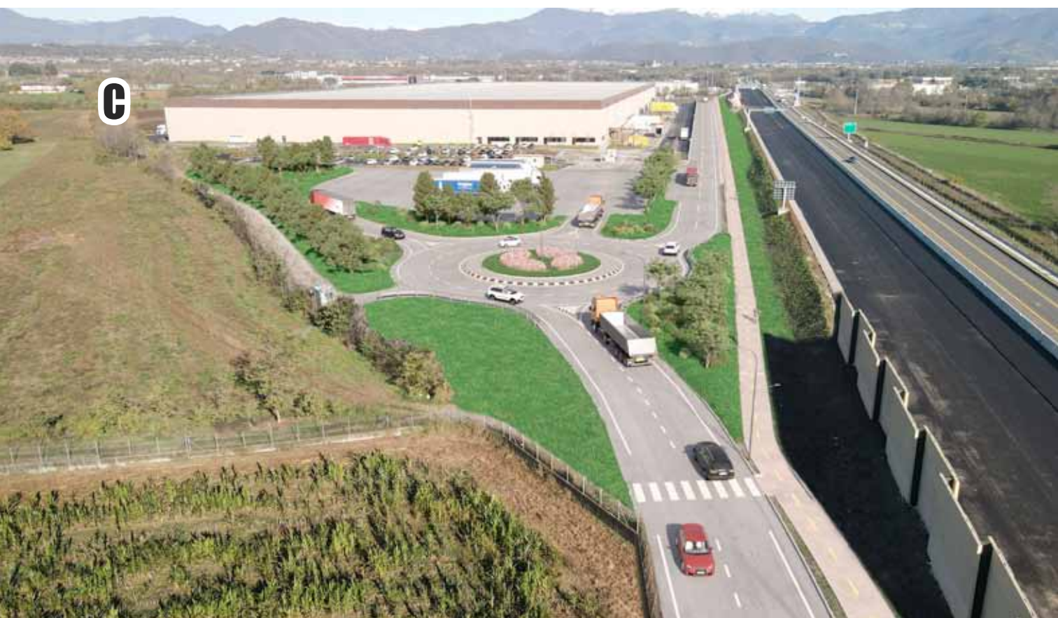
NUOVA STRADA NORD/SUD DI COLLEGAMENTO FRA VIA D. GHIDONI E VIA FALCONE