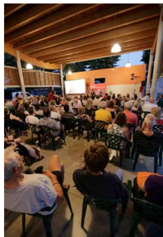
Uno dei tanti, partecipati eventi, realizzati con la biblioteca

biblioteca@comune.ospitaletto.bs.it T 030 641507