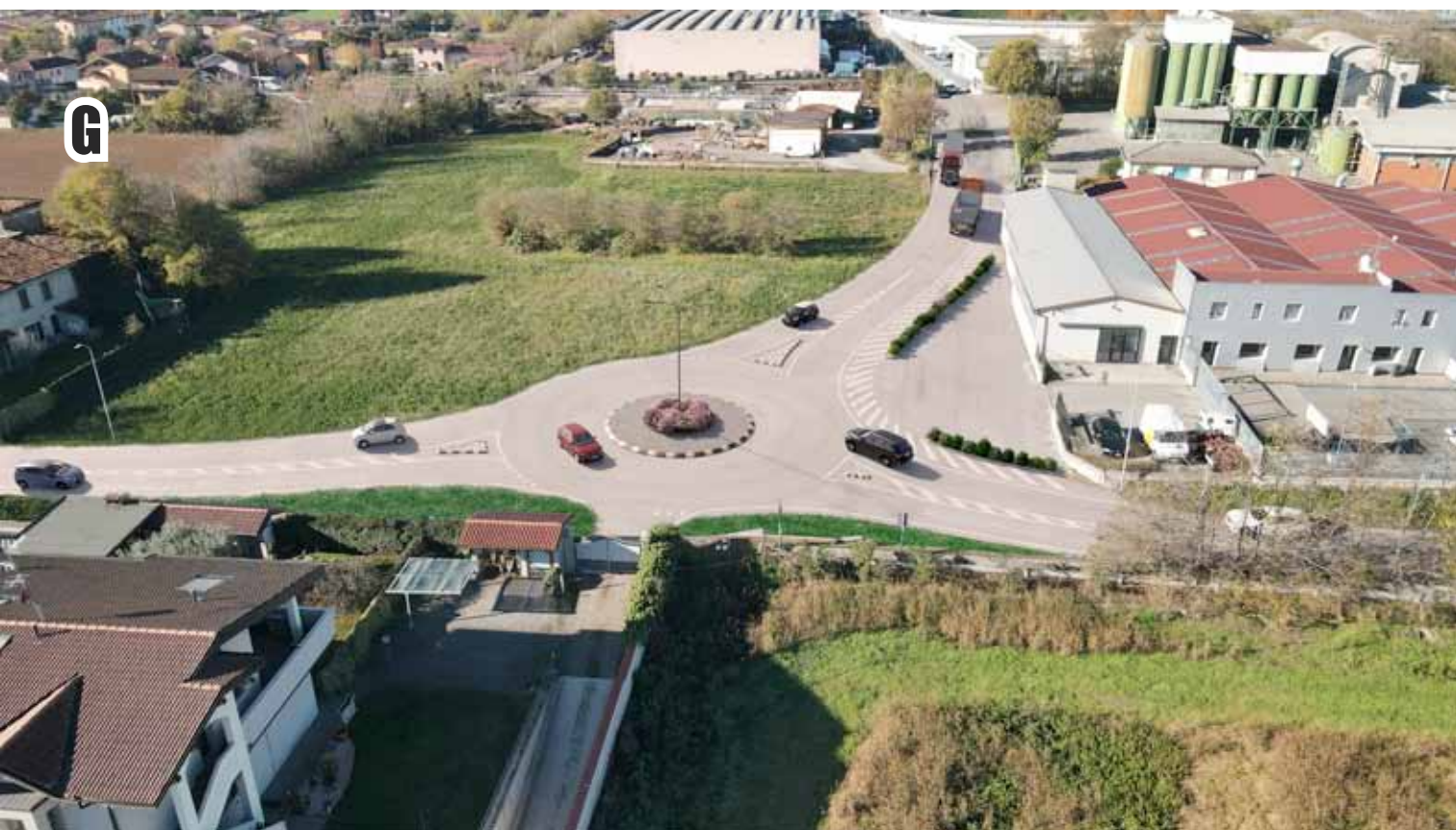
NUOVA ROTATORIA INTERSEZIONE VIA RIZZI - VIA FALCONE