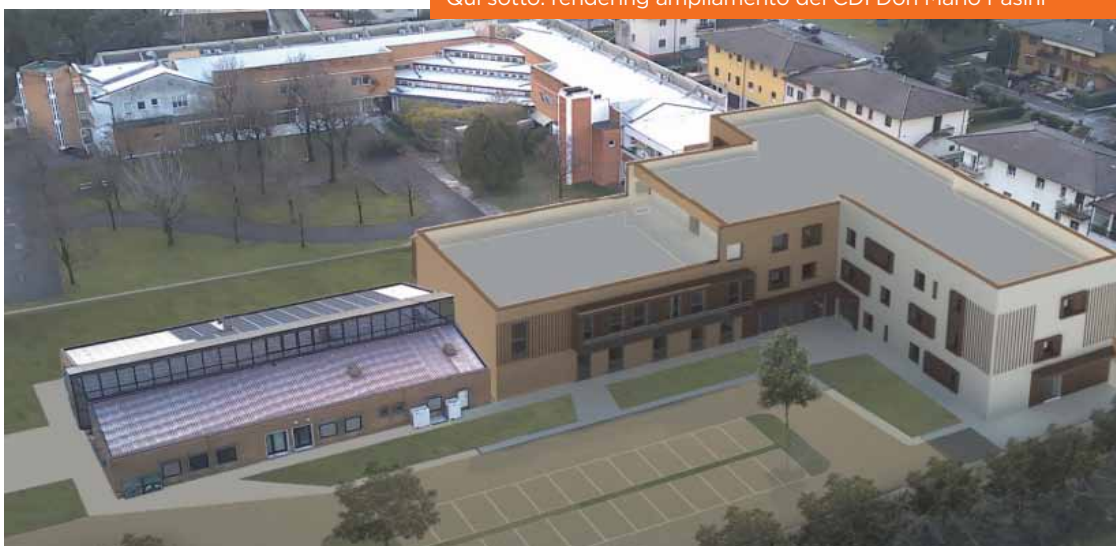
Qui sotto: rendering ampliamento del CDI Don Mario Pasini

• A.P.A: CIOÈ "ALLOGGIO PROTETTO PER ANZIANI". Struttura costituita da una o più unità abitative indipendenti (bilocali), messe a disposizione di anziani con fragilità sociali che scelgono l'alloggio come proprio domicilio. È caratterizzata dalla presenza di controllo e di protezione dell'ospite.