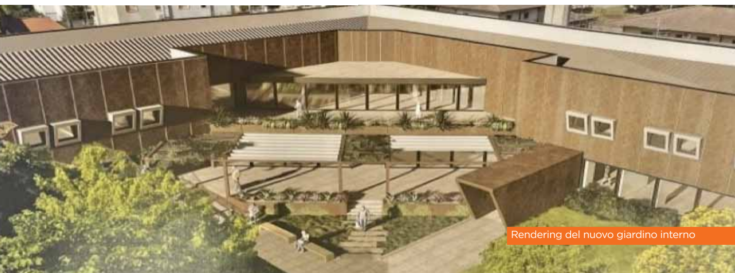
Rendering del nuovo giardino interno

Il cantiere della ristrutturazione può dirsi aperto ed il completamento dei lavori è previsto nel 2024.