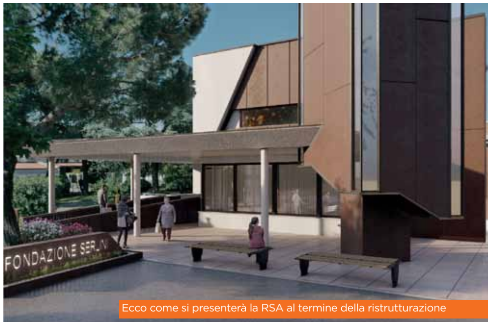
Ecco come si presenterà la RSA al termine della ristrutturazione