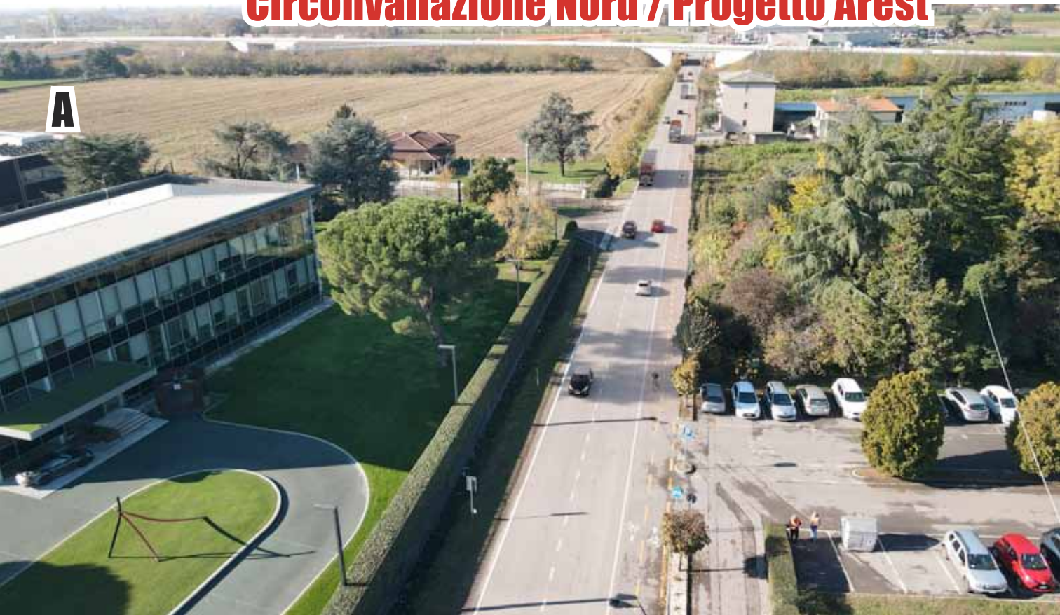
NUOVA PISTA CICLABILE LUNGO VIA D. GHIDONI FINO A CONFINE COMUNALE