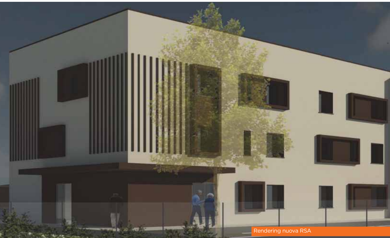
Rendering nuova RSA

economico. È fondamentale ricordare che il contributo può essere elargito a titolo di erogazione liberale a favore della Fondazione Serlini Onlus, con detrazione del 30% da Irpef o con deduzione del reddito imponibile fino al 10% del dichiarato ❖