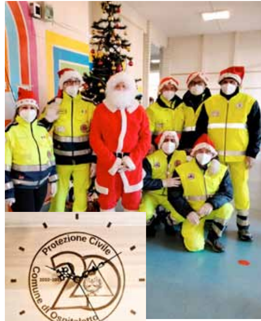
Qui sopra: all'asilo lo scorso anno con i bambini in occasione del Natale e, nel riquadro, l'orologio realizzato in occasione del 20° del gruppo, donato al Comune.

Il programma della giornata è arricchito dalla celebrazione annuale della messa provinciale del volontariato di Protezione Civile che si terrà nella chiesa parrocchiale di Ospitaletto, con la presenza di centinaia di volontari provenienti da tutto il territorio bresciano; seguirà al termine un rinfresco nel salone Agape dell'oratorio. Una festa, ma anche un momento per rilanciare le azioni della Protezione Civile, fare il punto sulla situazione attuale e rinnovare il grazie della comunità al prezioso lavoro quotidiano dei volontari della Protezione Civile. Nella giornata di lunedì 19 alcuni volontari di Protezione Civile si recheranno presso le scuole dell'infanzia di Ospitaletto, con una slitta e un babbo natale per omaggiare i bambini di caramelle e rinnovare una presenza che ormai prosegue da molti anni ❖