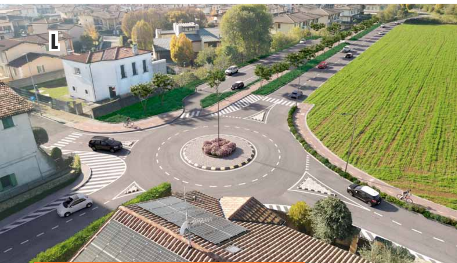
COLLEGAMENTO VIA INDIPENDENZA - VIA RIZZI - VIA ALLENDE