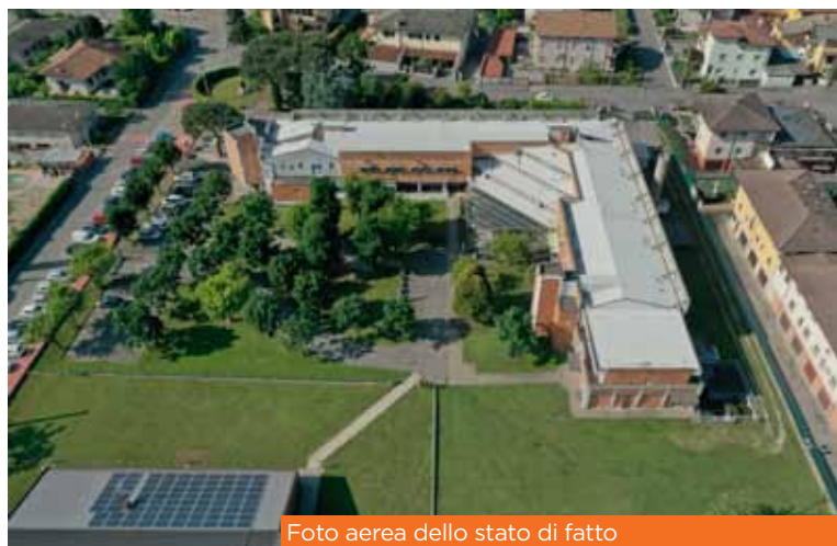
Foto aerea dello stato di fatto

• C.A.S.A: ACRONIMO DI "COMUNITÀ ALLOGGIO SOCIALE ANZIANI". Un'unità d'offerta residenziale, di tipo sociale, in grado di