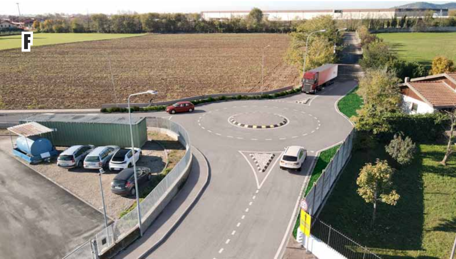
NUOVA ROTATORIA INTERSEZIONE VIA MANZONI - VIA FALCONE