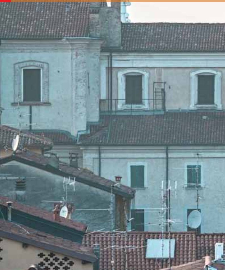
VILLA PRESTI FUTURO MUSEO "D. GHIDONI"

PERIODICO TRIMESTRALE DEL COMUNE DI OSPITALETTO (BS) | NOVEMBRE 2022