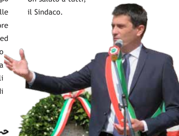
il Sindaco Giovanni Battista Sarnico