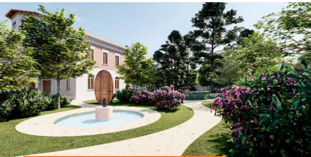
Qui sopra: come si presenterà Villa Presti al termine dei lavori

Diventerà un punto di riferimento per studiosi, appassionati, curiosi. Accanto ad una sezione permanente, con le opere di Ghidoni appartenenti al Comune e ad alcuni collezionisti in comodato, sono previsti uno spazio per i laboratori didattici, un archivio ed una parte destinata ad ospitare eventi temporanei. Anche il parco circostante sarà in primo piano, ospitando installazioni e manifestazioni diverse.