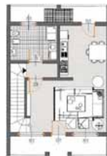
Piano Terra con giardino privato