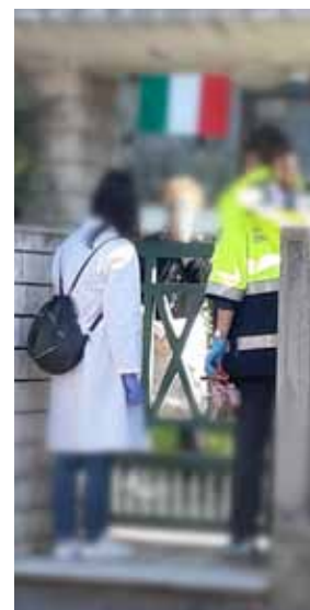
foto). Stretto il rapporto con ASST degli Spedali Civili per le famiglie con disabili maggiorenni (circa 20) che hanno interrotto la frequenza ai servizi diurni nonché la gestione dei rapporti con gli Ist. Comprensivi per garantire progetti di "didattica a distanza" per i minori disabili e il coordinamento con la cooperativa ITACA che garantisce gli assistenti ad personam garantito in videochiamata ■

S ettimane intense per i Servizi Sociali che per rispondere tempestivamente all'emergenza si sono messi in rete con la Protezione Civile e i medici di base e del lavoro . Una sinergia utile a garantire la continuità dei servizi di domicilio: per consegna di beni di prima necessità, farmaci, monitoraggio di alcune situazioni di fragilità già conosciute e il servizio di assistenza domenica agli anziani . Quest'ultimo trasformato con servizio di prossimità, con visite sulla soglia delle abitazioni di un operatore della cooperativa SAD e un volontario della protezione civile (come in